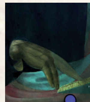
fig. 3 Particolare mano di San Marco